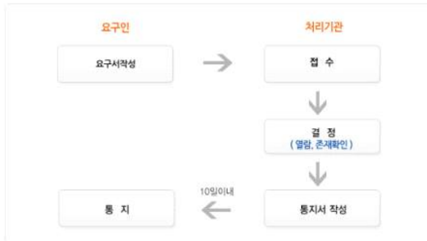
[별지1] 개인영상정보 열람 및 존재확인 요구서

양서고등학교는 정보주체가 개인영상정보의 열람 또는 존재확인 요구를 할 경우 10이내에 이용자에게 결과를 통지합니다. 개인영상정보의 열람 또는 존재확인 요구는 개인영상정보처리기기 운영부서를 통하여 가능하며 처리 절차는 다음과 같습니다.